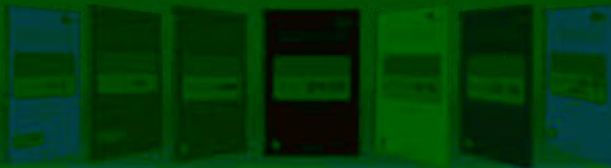
一体化课程教学设计 综合实训基地